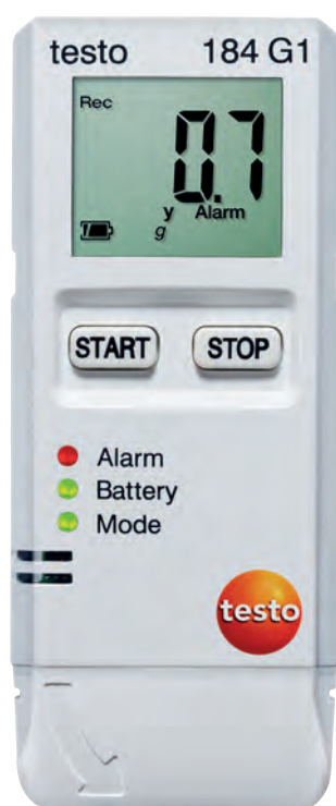
Реальный размер прибора

Все преимущества логгеров данных testo 184 с первого взгляда.