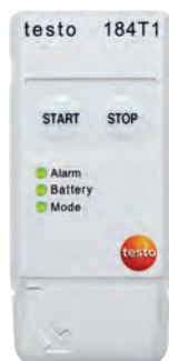
testo 184 T1

Обзор линейки логгеров данных testo 184.