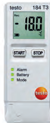
testo 184 T3