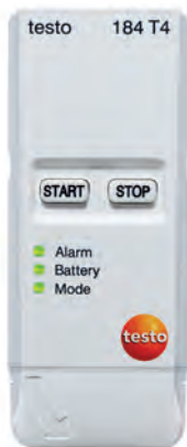
testo 184 T4