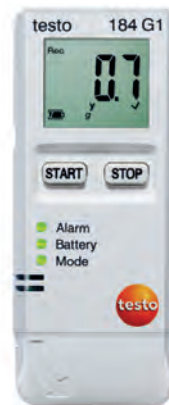
testo 184 G1